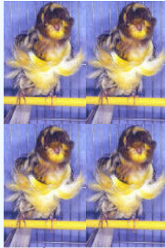
PÍOS MELANICOS Más superficie melanica que lipocroma, 6% al 50%.

MANCHAS EN ZONAS DE PIEL O CÓRNEAS, NO SE CONSIDERARÁN (excepto en los Moña Alemana, Lizard, Lancashire y Rheinlander.)