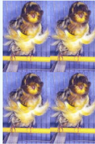
PÍOS MELANICOS Más superficie melanica que lipocroma, 6% al 50%.

MANCHAS EN ZONAS DE PIEL O CÓRNEAS, NO SE CONSIDERARÁN (excepto en los Moña Alemana, Lizard, Lancashire y Rheinlander.)