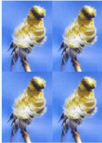
PÍOS LIPOCROMOS. Más superficie lipocroma que melanica, 6% al 50%.

Píos o manchados, los más homogéneo posible: Todos intensos ó todos nevados